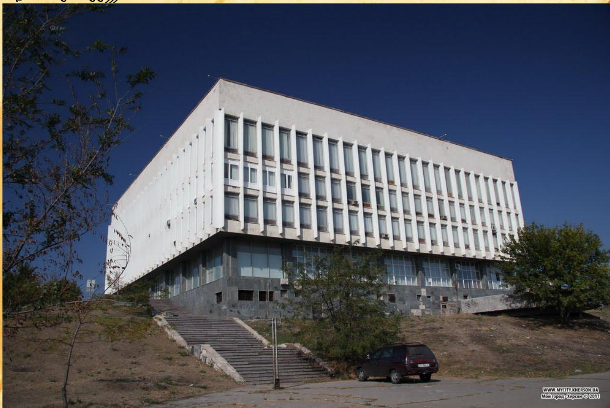
Обласна бібліотека ім. Олесь Гончар. Заснована 18 червня 1972 року.

Зрозуміло, що Гончар питав про книжки, які потрібно читати, а чабан відповідав про ошадні книжки)))